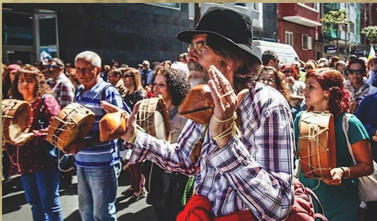
TAMBORES Y CHÁCARAS