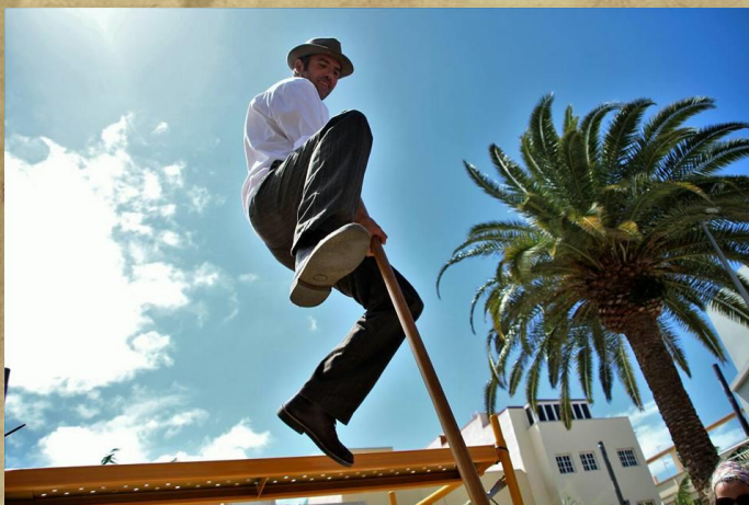
JUEGOS TRADICIONALES CANARIOS